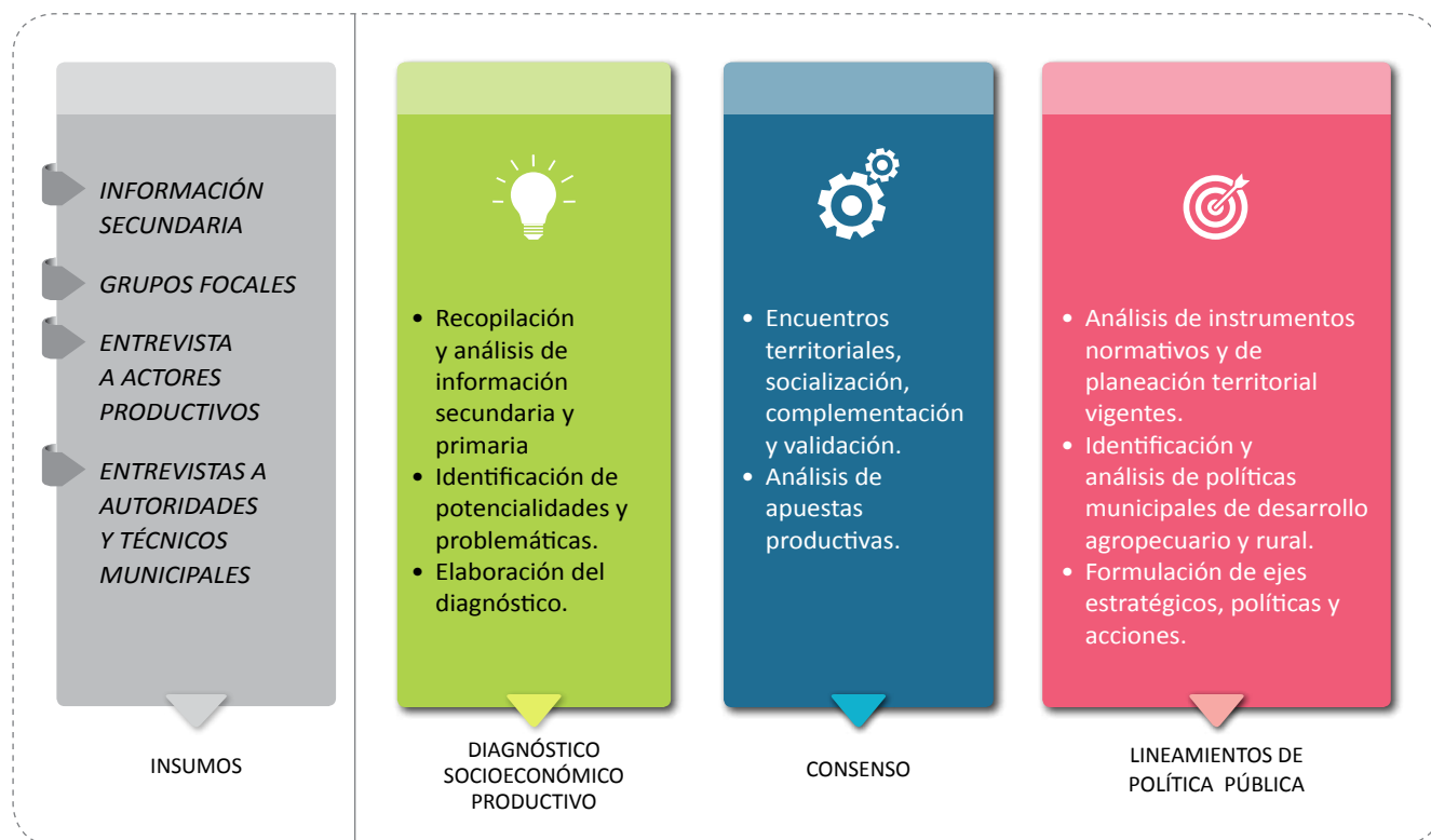
FIGURA N° 1. Proceso metodológico para la elaboración de los lineamientos de política pública para el fortalecimiento productivo