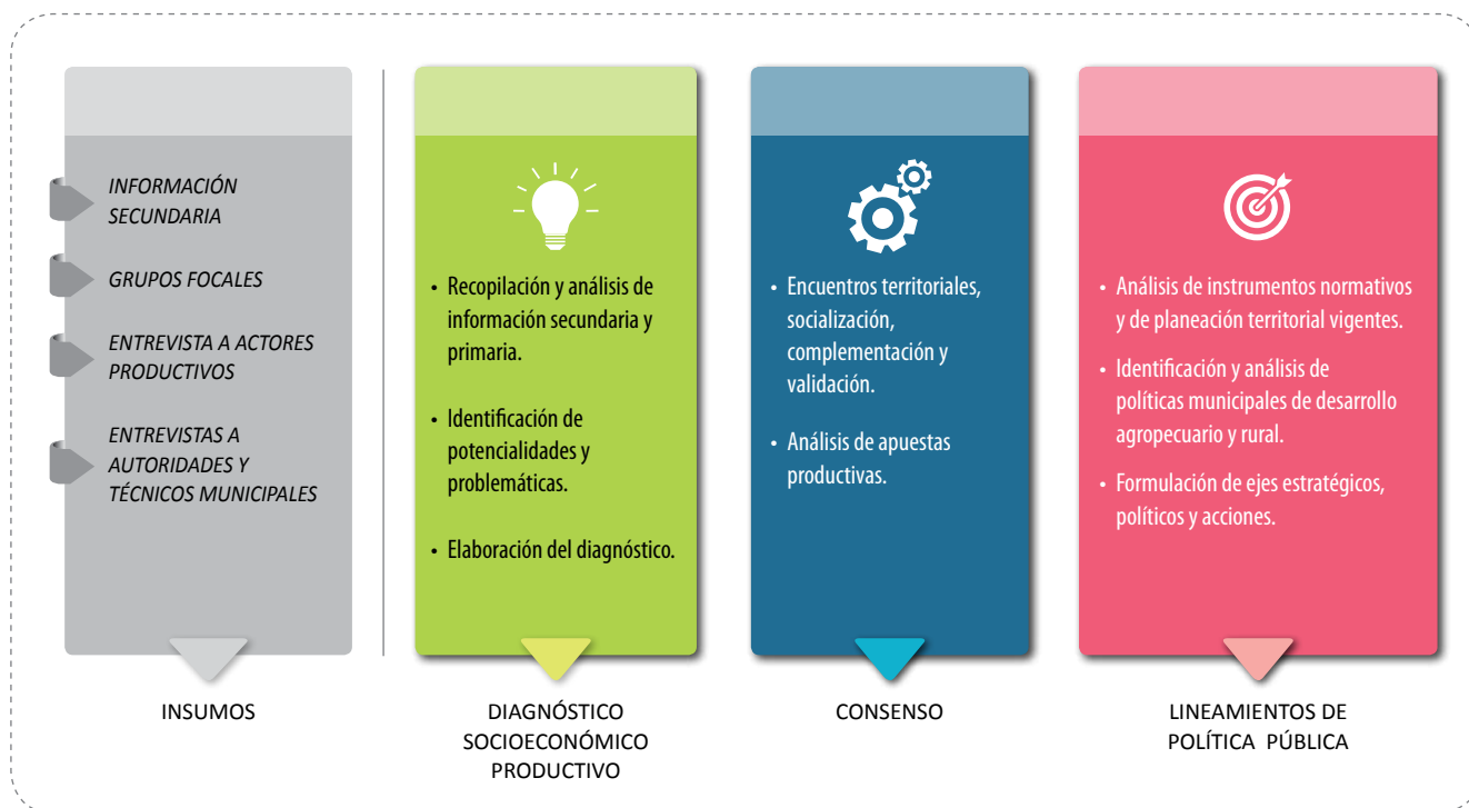
FIGURA N° 1. Proceso metodológico para la elaboración de los lineamientos de política pública para el fortalecimiento productivo